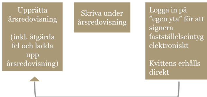
Figur 6 Översikt över de steg i processen som behöver upprepas.

Utifrån antagandet om att 3 procent av företagen behöver upprepa processen beräknas den sammantagna kostnaden för den ökade tidsåtgången till 0,4 miljoner kronor för företagen.