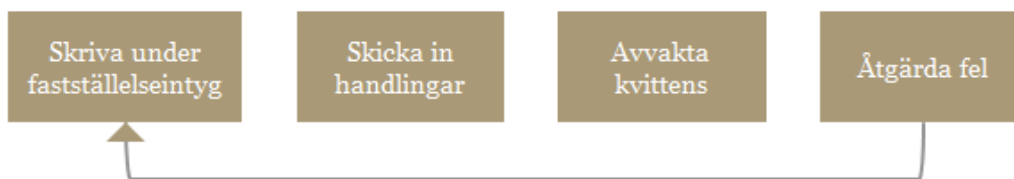
Figur 5 Översikt över de steg i processen som behöver upprepas.

Utifrån antagandet om att 8 procent av företagen behöver upprepa processen beräknas kostnaden för den ökade tidsåtgången och kostnaden för en ytterligare postgång till omkring 4 miljoner kronor för företagen totalt.